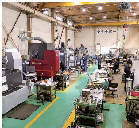
最新鋭の機械設備がずらり